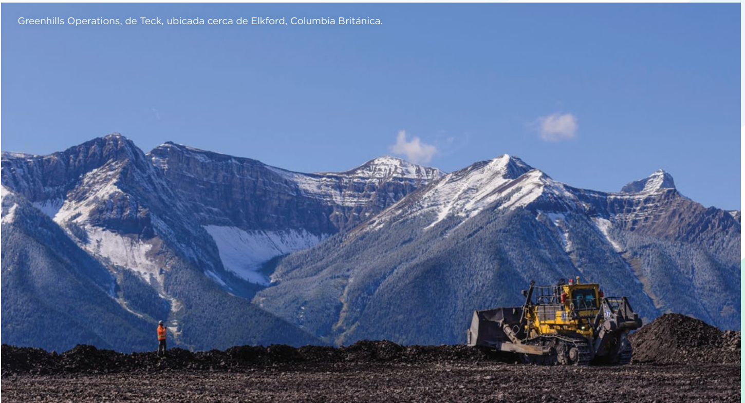
Greenhills Operations, de Teck, ubicada cerca de Elkford, Columbia Británica.

Otro de los roles que cumple el Panel de COI está relacionado con el proceso de revisión posterior a la verificación, un componente clave del marco de aseguramiento del programa TSM, como se describe anteriormente.