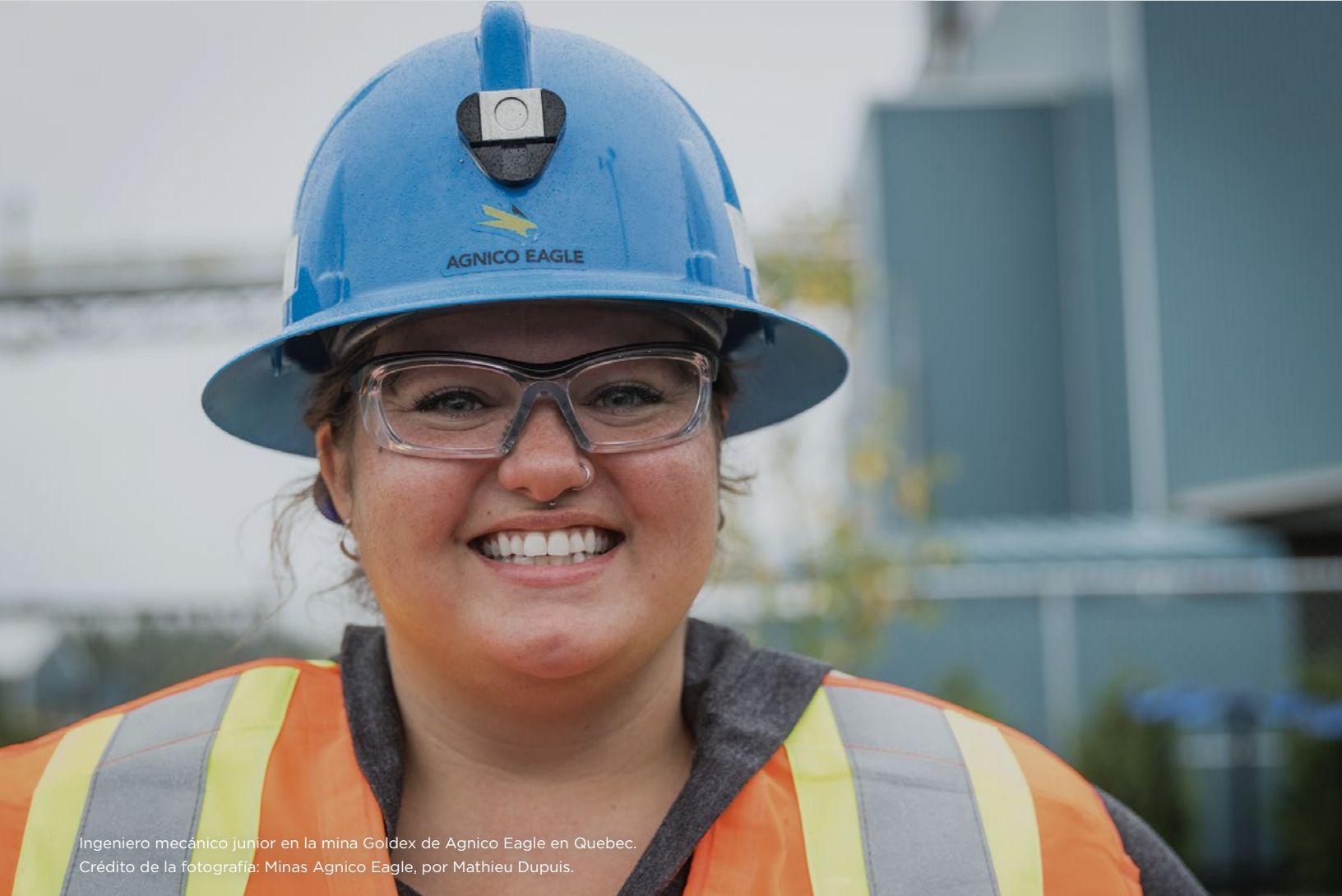
Ingeniero mecánico junior en la mina Goldex de Agnico Eagle en Quebec.